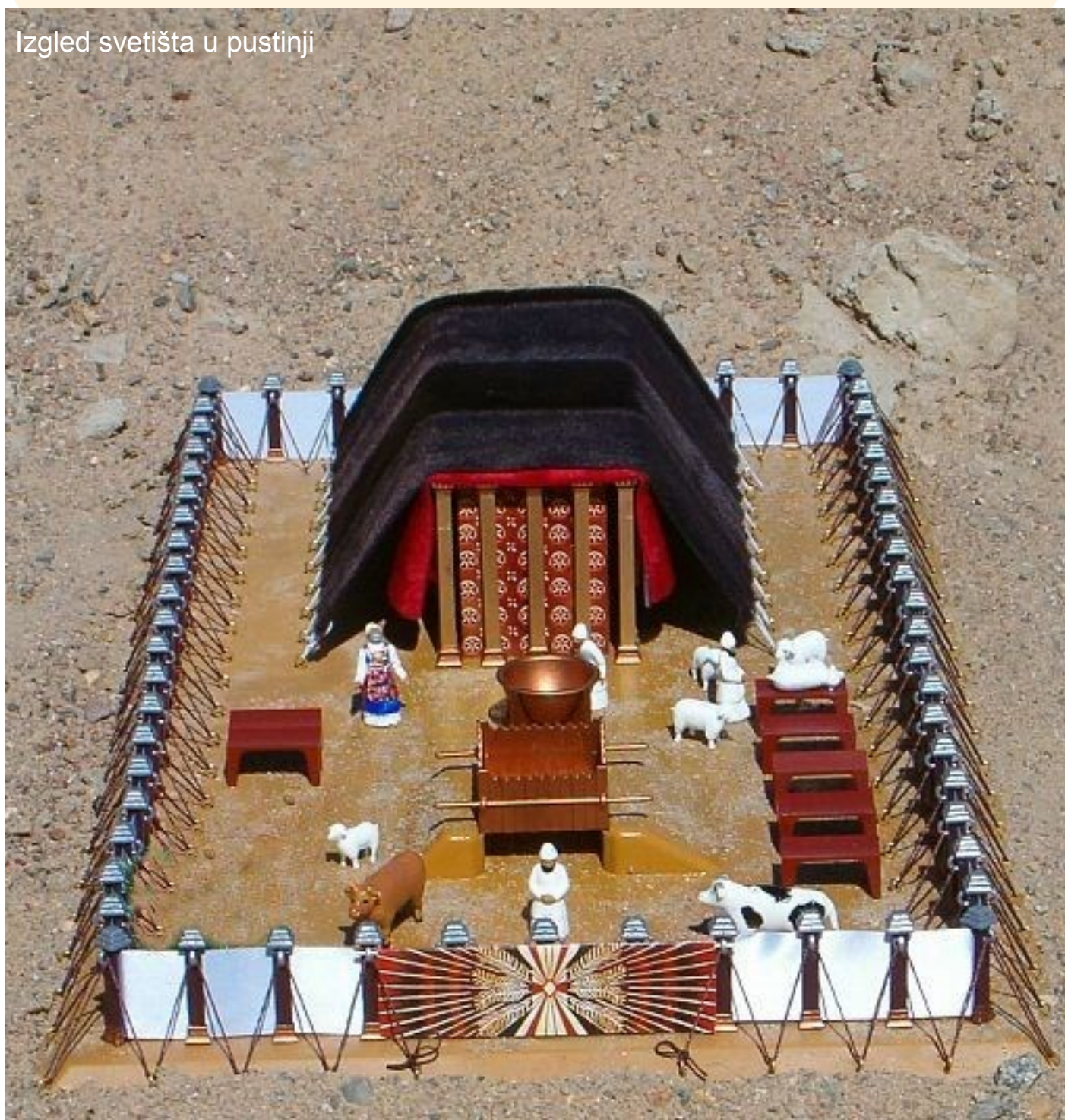
Izgled svetišta u pustinji